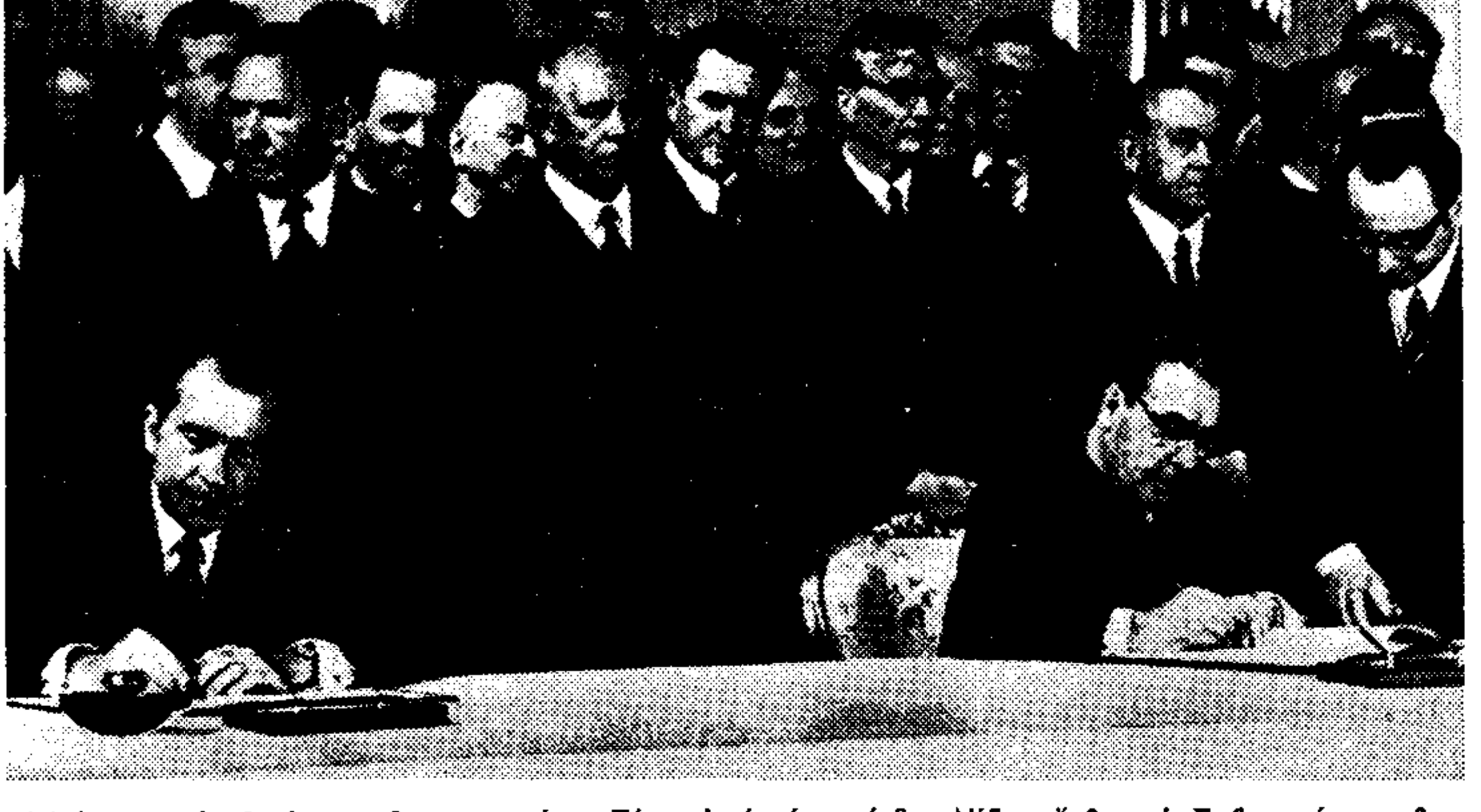
Η υπογραφή της ιστορικής συμφωνίας. Πίσω από τόν πρόεδρο Νίξον, δεξιά, ο Σοβιετικός πρόεδρος Μπρέζνιεφ και ο πρόεδρος Ποντγκρνεφ. Ο Λεονίντ Μπρέζνιεφ δεξιά. Στο κέντρο της εικόνας, με γυαλιά, ο θεωρητικός του Κόμματος, Μιχαήλ Σουζλόφ.

Δεν υπάρχει καμιά αλλαγή στην πολιτική τακτική της Κυβερνήσεως. Αυτό εδλώσε χθες βράδυ προς τους πολιτικούς συντάκτες των αθηναϊκών εφημερίδων ο υφυπουργός κ. Βύρων Σταματοπούλος. Η δήλωση έγινε εξ' αφορμής των φημών που κυκλοφορούν τελευταία ότι η Κυβέρνηση κεραιλήμενη πολιτικής της στάσης της. Ανασφαιρόμενος, εξ' άλλου ο κ. υφυπουργός σε μία πρόσφατη συνέντευξη του στη νοσηρική τηλεόραση, δήλωσε ότι τή της μορφή του Πολιτεύματος καθορίζονται επακριβώς από τή Συνταγμα του 1968, που παραμένει ο βασικός γνώμων.