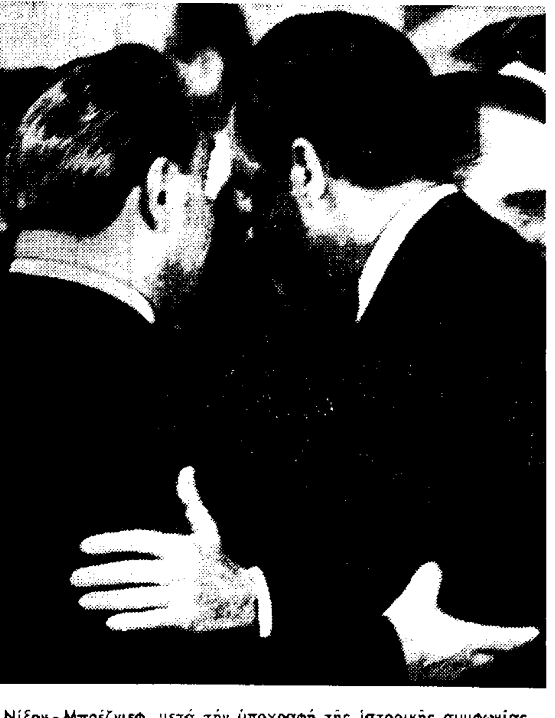
Νίξον - Μπρέζνιεφ, μετά την υπογραφή της ιστορικής συμφωνίας.

ΑΠΟ ΤΗΝ ΚΥΒΕΡΝΗΣΗ ΜΕΛΕΝ Νέο κύμα συλλήψεων στην Τουρκία ΤΑ ΚΟΜΜΑΤΑ ΔΥΣΦΟΡΟΥΝ